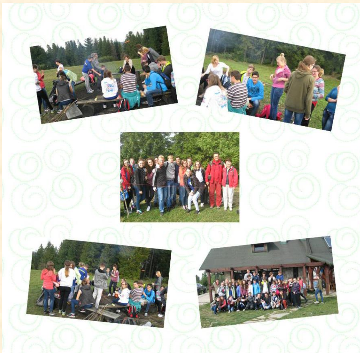
Rysunek 4. Zdjęcia z akcji „sprzątania gór” w udziale wolontariuszy.