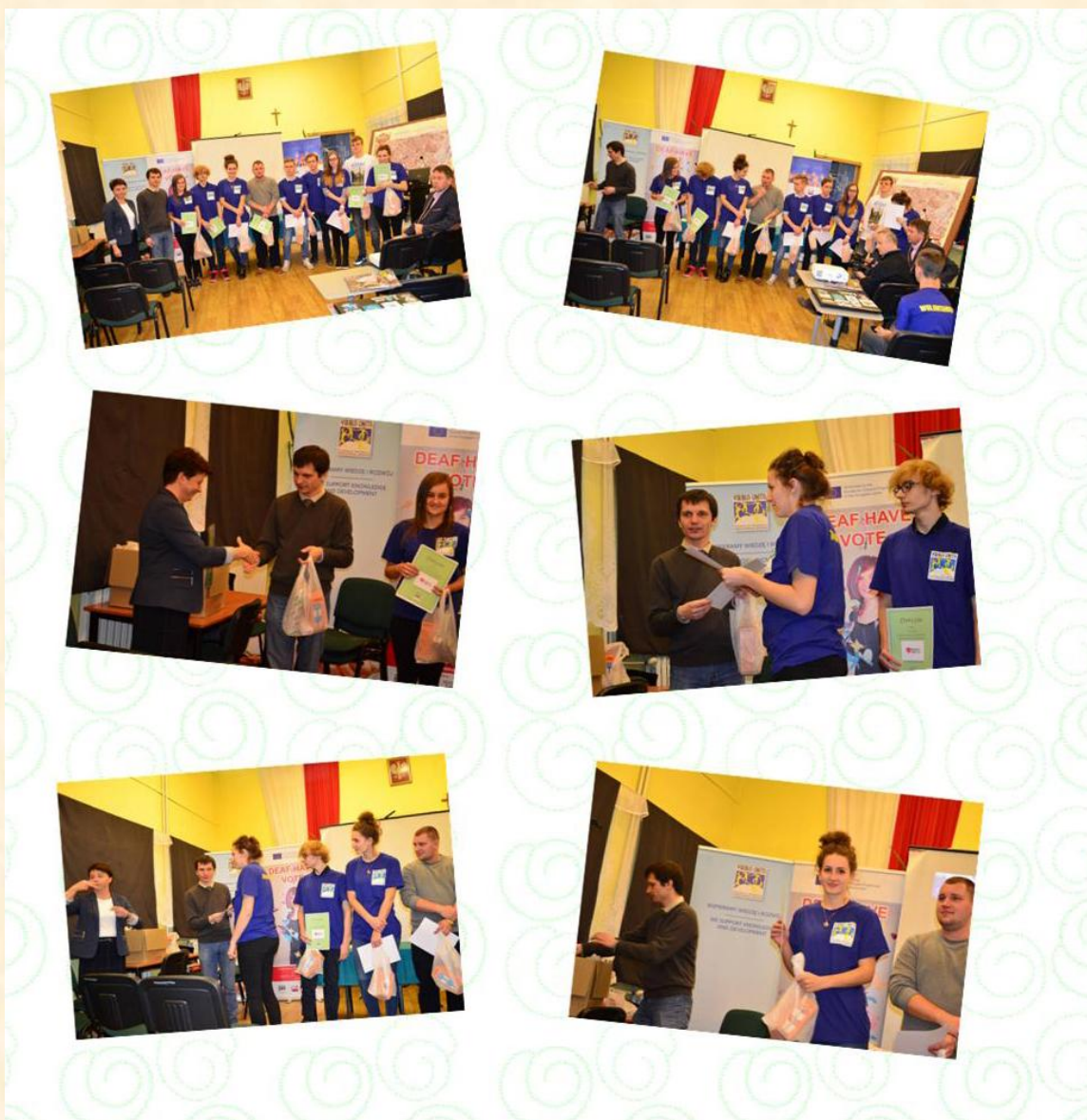
Rysunek 5. Zdjęcia z uroczystej gali, w trakcie której wolontariusze otrzymali dyplomy za udział w działalności Szkolnego Koła Wolontariatu oraz za pomoc w realizacji filmu o dopalaczach wśród Głuchych.